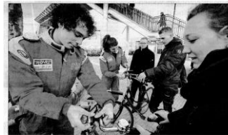
'Pitsstraat' bij station

In Overijssel werken de scholen en de politie sa-