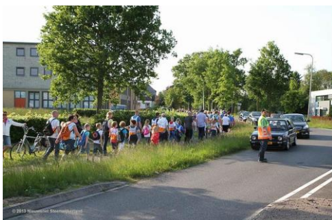
verkeersregelaars tijdens avondvierdaagse