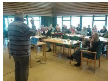
Foto: opfriscursus in Giethoorn

Identiek aan de BROEM-cursus waarbij het onderdeel rijvaardigheid achterwege blijft. De cursus wordt gehouden in Giethoorn, Scheerwolde en Kuinre. Per locatie kunnen ca. 40 mensen deelnemen aan de cursus.